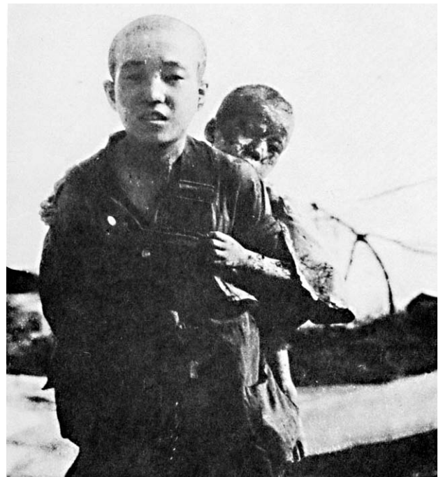
Kinder aus Hiroshima fliehen vor dem Inferno