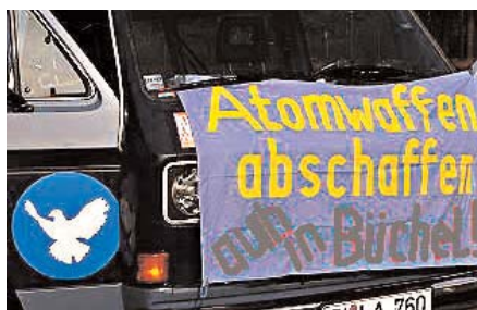
Aktionstag am 4.9.05 in Büchel

In dieser Situation wäre eine Stärkung des Atomwaffensperrvertrags dringend geboten. Doch die Mitglieder des Sicherheitsrats und Deutschland verfolgen auf Druck der USA im Zusammenhang mit dem Atomprogramm des Iran eine Politik, die den Vertrag aushöhlt. Unter Androhung von Sanktionen – möglicherweise auch Krieg – wollen sie den Iran zwingen, auf sein Recht der zivilen Nutzung der Atomenergie zu verzichten, das der Sperrvertrag allen Unterzeichnerstaaten ausdrücklich zusichert. Sie wollen, dass der Iran den Brennstoff für seine Atomkraftwerke von ihnen bezieht. Damit wird die Gefahr heraufbeschworen, dass der Iran und andere Staaten den Atomwaffensperrvertrag kündigen und sich der internationalen Kontrolle über ihr Atomprogramm entziehen.