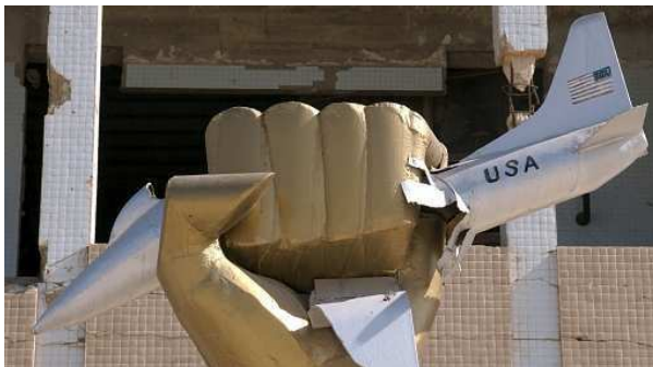
Die Skulptur einer Faust, die ein US-Kampfflugzeug zerquetscht, steht vor einem Wohnhaus der Gaddafis (Archivaufnahme 2004)

Frankreich, Großbritannien und die USA haben mit ihren Luftangriffen vom Wochenende auf Waffen und Infrastruktur der libyischen Regierungstreitkräfte wahrscheinlich verhindert, dass diese Benghazi erobern und dort ein Blutbad anrichten. Damit war das dringlichste humanitäre Ziel erreicht. Doch wie soll es weitergehen? Darüber herrscht unter den an der Militäraktion beteiligten westlichen Staaten sowie den arabischen Nachbarländern Libyens große Uneinigkeit.