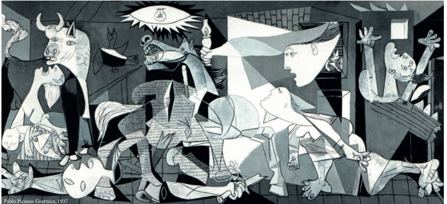
Pablo Picasso: Guernica, 1937