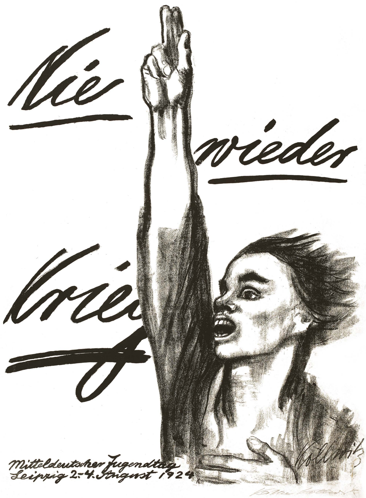
"Nie wieder Krieg!" - Antikriegsplakat zum Mitteldeutschen Jugendtag 1924 von Käthe Kollwitz.